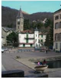
Bassin des Ladres