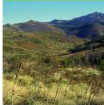
Paysage du Chioula

Du croisement de pistes sous le refuge, prendre la piste orientée sud-est en direction du col d'Ijou . Juste avant le col, quitter la piste et atteindre le col par un bon chemin qui descendra plus franchement dans la forêt puis dans la lande au moyen de quelques lacets avant de rejoindre une piste en fond de vallon que l'on suit à droite jusqu'au village de Sorgeat . A l'extrémité est du village, une piste conduit à Ascou . En haut d'Ascou, traverser à flanc le village pour trouver un sentier qui monte légèrement avant de rejoindre une petite route que l'on prend dans le sens de la descente jusqu'à la RD25 au niveau du lac de Goulours. Poursuivre sur la D25 jusqu'au hameau de La Forge et son gîte d'étape.