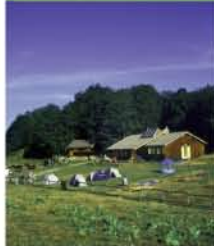
Refuge du Chioula

Prendre la rue à droite du casino montant au cimetière. De là, un sentier s'élève rapidement pour rejoindre le lotissement Le Bosquet. Rejoindre la route départementale, la suivre quelques instants à gauche et reprendre l'ascension par sentier jusqu'au village d'Ignaux. Sur la place du village, prendre une rue à gauche qui, après avoir passé un lavoir, mène aux dernières maisons à l'ouest. Emprunter le sentier en direction du refuge du Chioula. Il grimpe d'abord à flanc de versant, traverse la route du col du Chioula puis poursuit, plus raide, pour atteindre la crête de La Serre. Rester d'abord à l'orée de la forêt puis monter sur la crête et rejoindre une piste forestière. La suivre sur la gauche. Arrivés à un croisement de pistes, vous atteindrez le refuge du Chioula (1600m) en quelques instants.